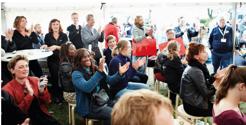
DCH på Folkemødet. Mennesker med handicap kom til orde, da vi offentliggjorde vores undersøgelse om handicap i medierne på Folkemødet 2013 sammen med TV-Glad.

Medborgerskab er at være med til at bestemme, hvor samfundet skal hen og have de samme muligheder for at være med i samfundet som alle andre. Det er indlysende rigtigt, men svært at gøre i hverdagen. Vi arbejder for, at mennesker med handicap kan bruge deres medborgerskab fuldt ud hvad enten det drejer sig om retssikkerhed , brugerindflydelse eller deltagelse ved valg. Vi prøver at inspirere andre til at arbejde for det mål sammen med os.